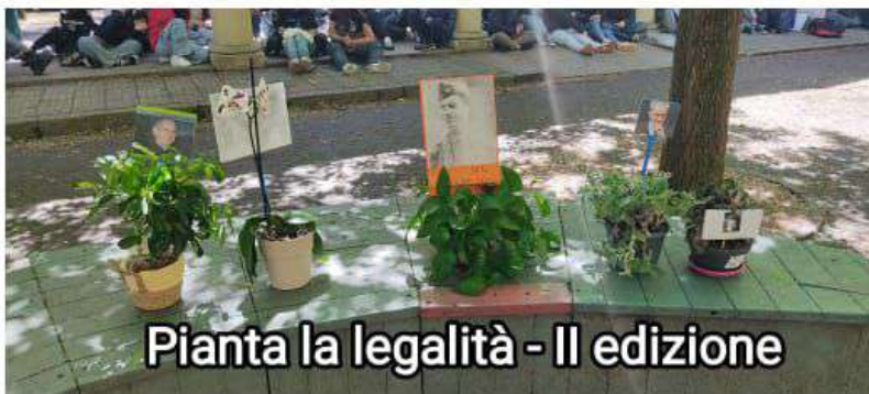
Pianta la legalità - II edizione